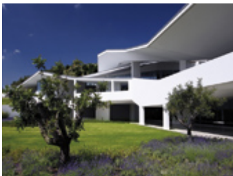
VISTA CON OJO SANO