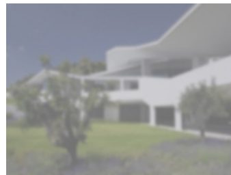
VISTA CON CATARATA

“Es aconsejable realizar revisiones anuales, sobre todo a partir de los 45 años, para detectar la posible existencia de una catarata”.